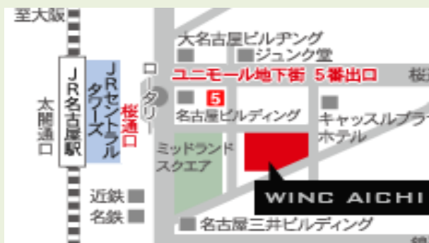
◎JR名古屋駅桜通口から：ミッドランドスクエア方面 徒歩5分 ◎ユニモール地下街 5番出口 徒歩2分

■会場：ウインク愛知 11F 1107号室 （WINC AICHI 愛知県産業労働センター）